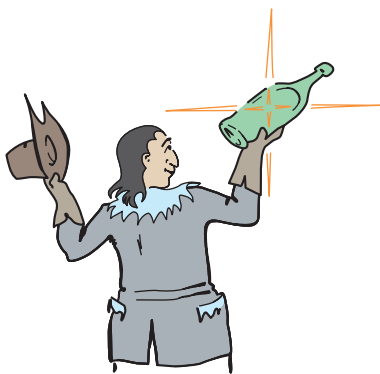
Рис. 2. “Звезда в бутылке” (рисунок И.В. Новожилова)