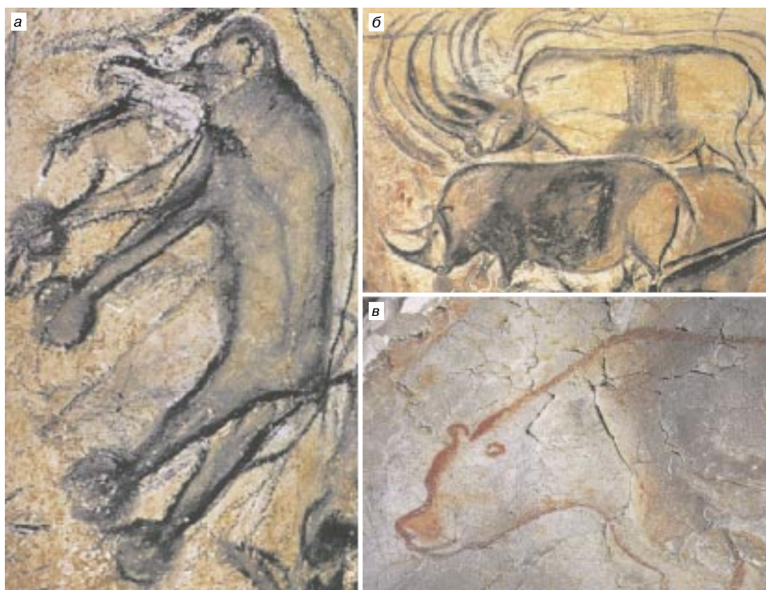
Рис. 1. Исчезнувшие млекопитающие в изображениях позднепалеолитических охотников из пещеры Шове (юг Франции). Возраст рисунков 30–32 тыс. лет (из [5]: а – мамонтенок, б – носорог Мерка (предположительно), в – пещерный медведь

лишь костные останки, а кератиновые “рога” не сохранились. Таким образом, открытие в пещере Шове ставит перед нами вопрос: какой вид носорогов был известен ее обитателям? Почему носороги из пещеры Шове изображены стадами? Весьма вероятно, что в исчезновении носорога Мерка также повинны охотники палеолита.