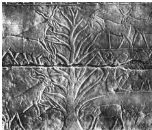
Рис. 4. Козы ошипывают дерево, уничтожая листья, ветви и кору. Экологическая роль домашних коз была ясна уже в Древнем Египте. Барельеф из мастабы Ахутхотепа, Древнее царство, V династия, 2563–2423 годы до н.э. Лувр, Париж

дородных заливных угодий и тугаев возникли глинистые и солончаковые пустыни и полупустыни.