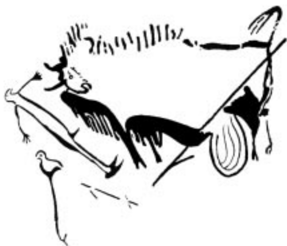
Рис. 2. Сцена охоты: раненый зубр, поверженный охотник и птица, пещера Ласко (юг Франции, 17 тыс. лет, поздний ориньяк) (из: Воронцов Н.Н. Первым художником был охотник // Наука и жизнь . 1964. № 9. С. 146–148)

уничтожены. На стоянке Солютре (середина верхнего палеолита) во Франции были найдены остатки около десятка тысяч диких лошадей – тарпанов. На Амвросиевской стоянке на Украине были найдены остатки тысяч зубров.