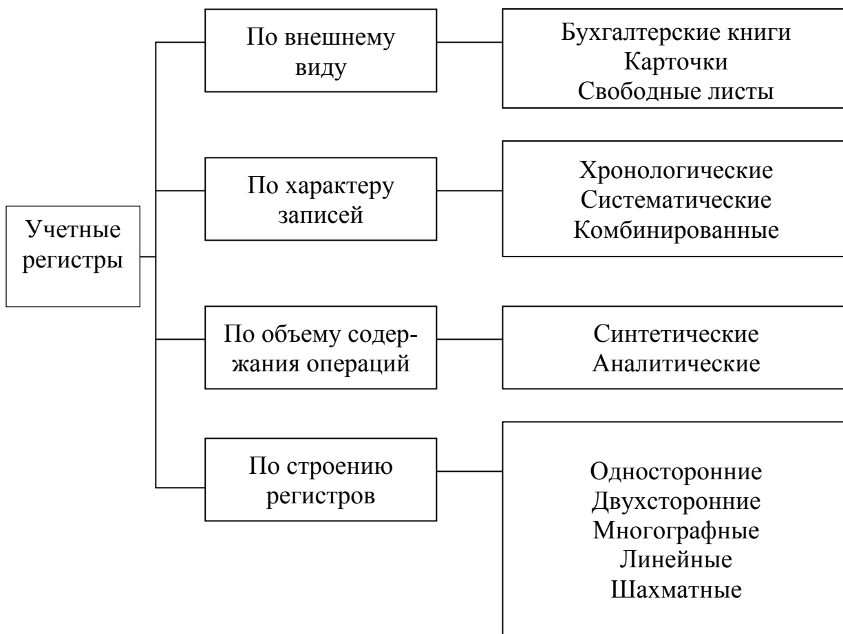
Рис. 6.1. Классификация учетных регистров