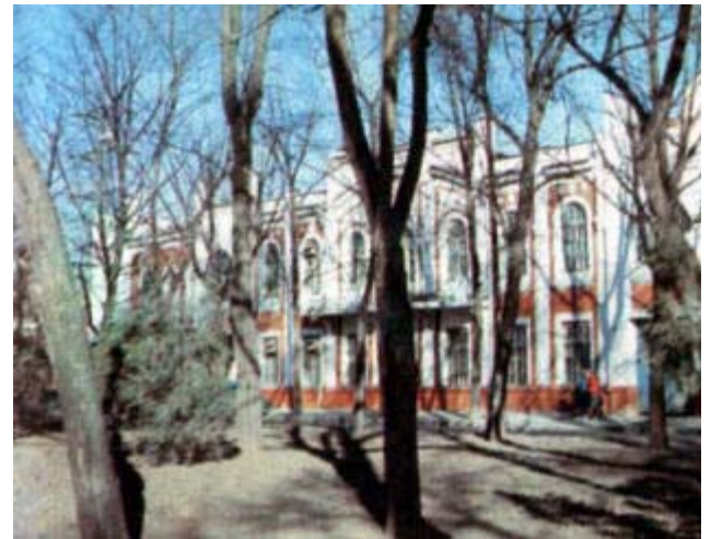
Учебный корпус Краснодарского политехнического института (ул. Красная, 166). В прошлом женская учительская семинария. Построена в 1910 г.