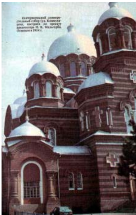
Екатерининский семипрестольный собор (ул. Коммунаров), построен по проекту архитектора И. К. Мальгерба. Освящен в 1914 г.