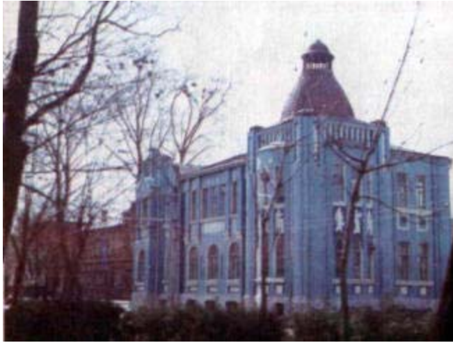
Здание на ул. Захарова, 61. Водолечебница. Построена в 1916 г. по проекту архитектора А. А. Козлова