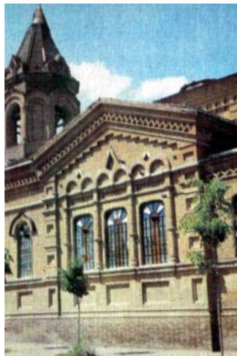
Ильинская церковь (во имя Св. пророка Ильи; ул. Октябрьская, 149). Построена по проекту архитектора Н. Г. Петина на добровольные пожертвования горожан в знак избавления от эпидемии холеры 1892 г. Освящена в 1907 г., колокольня построена в 1912 г.