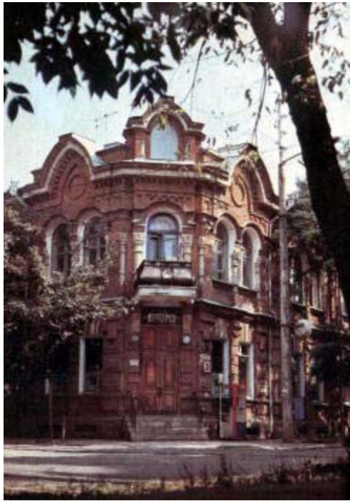
Городская прокуратура (угол ул. Красноармейской и Пушкина 4/49). Здание постройки 1924—1926 гг.