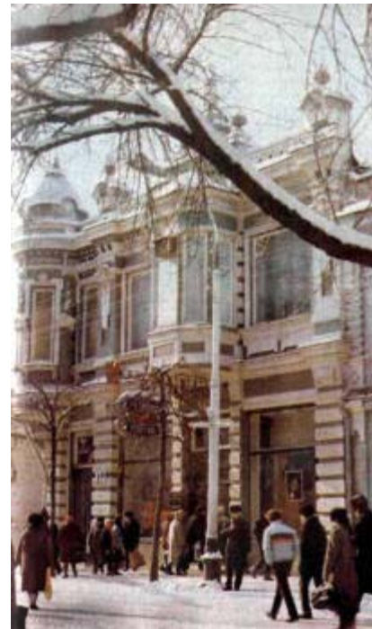
Магазин «Ткани» (ул. Красная, 69). В прошлом дом В. З. Полякова. Построен в начале XX в. В нем размещался музыкальный магазин Сарантиди