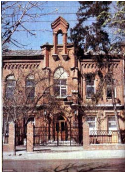
Ул. Октябрьская, 51. Бывшее здание евангелической лютеранской церкви, открытой в 1894 г. Ныне здесь размещается Краснодарское отделение Союза художников России.