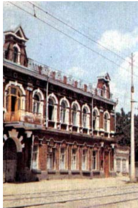
Здание на ул. Коммунаров, 119. Построено в конце XIX в. как жилой дом с торговыми помещениями