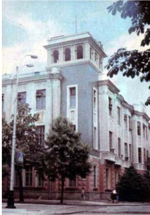
Административное здание по ул. Красной, 6. В прошлом дом ф. М. Акулова. Построен в 1914—1915 гг. по проекту архитектора А. А. Козлова. В апреле 1918 г. здесь размещался штаб Красной гвардии по обороне Екатеринодара от корниловцев